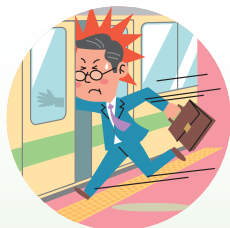
電車のドアに 手をはさまれ ケガをした