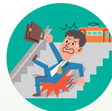
駅のホーム（駅構内）で 転んでケガをした

(注1) 駅構内とは、駅の改札口から入ってから出るまでの改札口の内側をいいます。