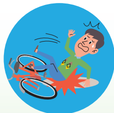
自転車運転中 転倒してケガをした