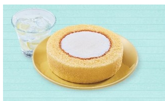
プレミアムロールケーキイメージ写真

※プレゼントは被保険者1名様毎にコーヒーとロールケーキの各1個、1世帯最大4名様分までとさせていただきます。