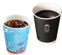
ブレンドコーヒーSまたはアイスコーヒーS